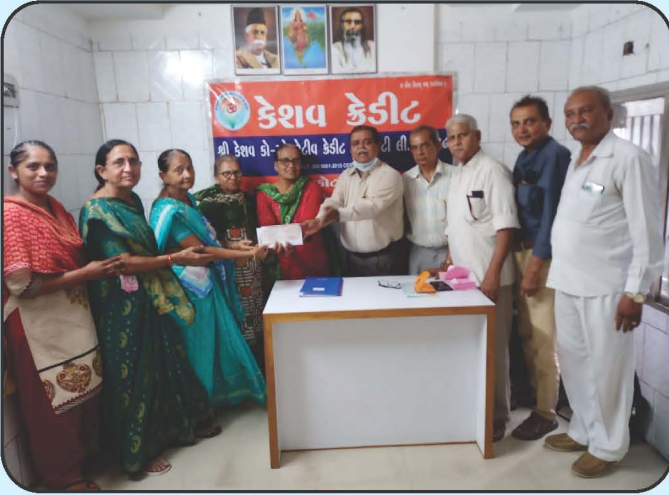
छाश केन्द्र राजकोटने आर्थिक अनुदान Cheque Distribution of Chhash Kendra Rajkot