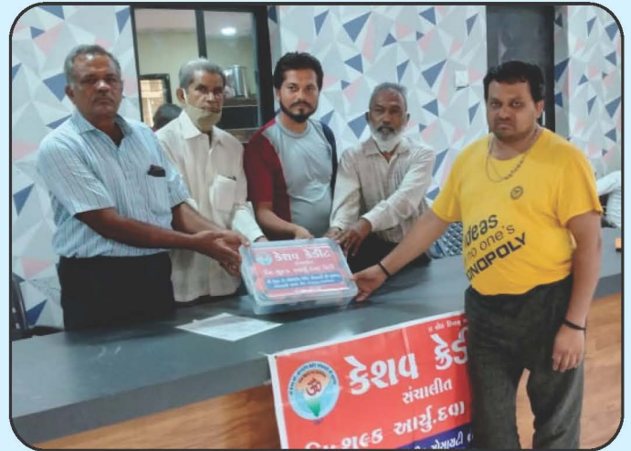
ગ્રામ્ય વિસ્તારોમાં ધનવંતરી કેન્દ્ર Dhanvantri Aushadh Kendra in Rural Area