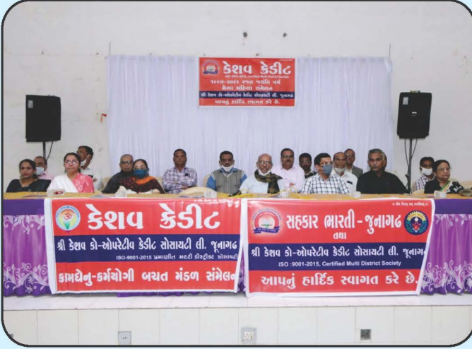
કામધેનુ જોઈન્ટ લાયાબીલીટી ગ્રૂપ મહિલા સંમેલન Kamdhenu JLG Women Confrence