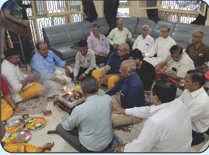
રજત જયંતિ વર્ષની ઉજવણી નિમિત્તે ગાયત્રી યજ્ઞ Rajat Jayanti Celebration with Gayatri Yagna