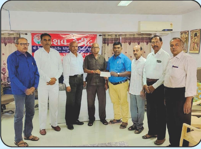
समर्पण हॉस्पिटल, केशोदने आर्थिक अनुदान Cheque Distribution of Samarpan Hospital, Keshod