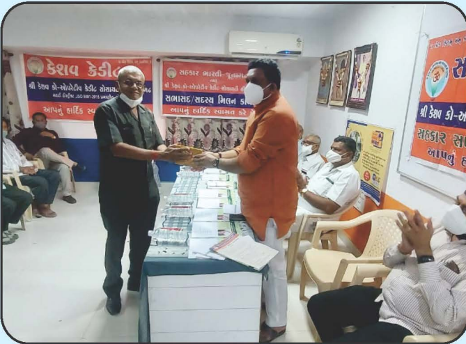
સહકાર સપ્તાહ ઉજવણી કાર્યક્રમ Sahkar Saptah Celebration