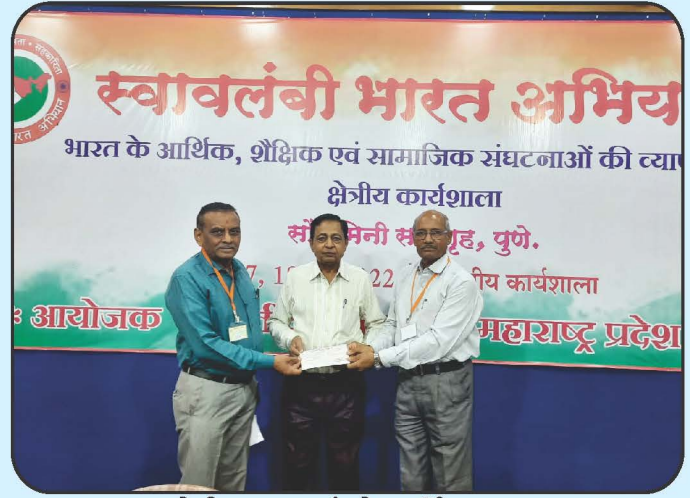
स्वदेशी जागरण मंचने आर्थिक अनुदान Cheque Distribution of Swadeshi Jagran Manch