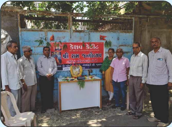
શાખાઓમાં શ્રી રામ જન્મોત્સવની ઉજવણી Shree Ram Navmi Celebration