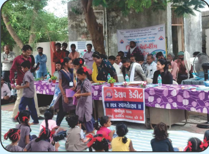
ગ્રામ્ય વિસ્તારની શાખાઓમાં છાત્ર સ્વાગત કાર્યક્રમ Chhatra Swagat Programme in Rural Area