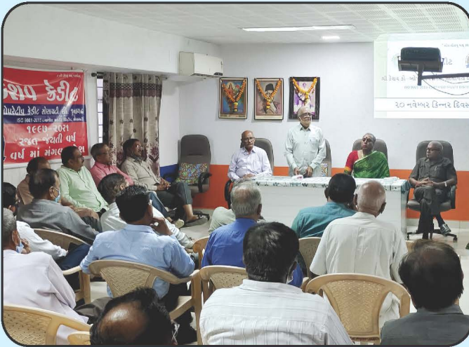
કિન્નર સમાજ સન્માન કાર્યક્રમ Honour Funcation for Kinnar Samaj