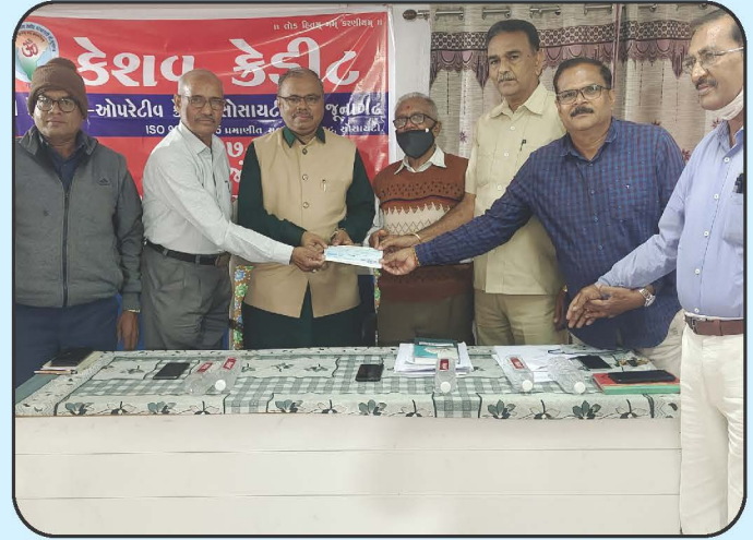
विद्या भारती गुजरातने आर्थिक अनुदान Cheque Distribution of Vidhya Bharti Gujarat