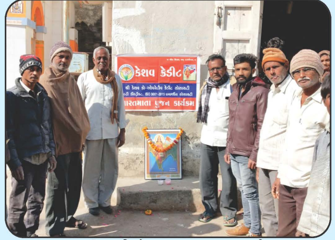
ગ્રામ્ય વિસ્તારોમાં ભારત માતા પૂજન કાર્યક્રમ Bharat Mata Pujan Programme in Rural Area