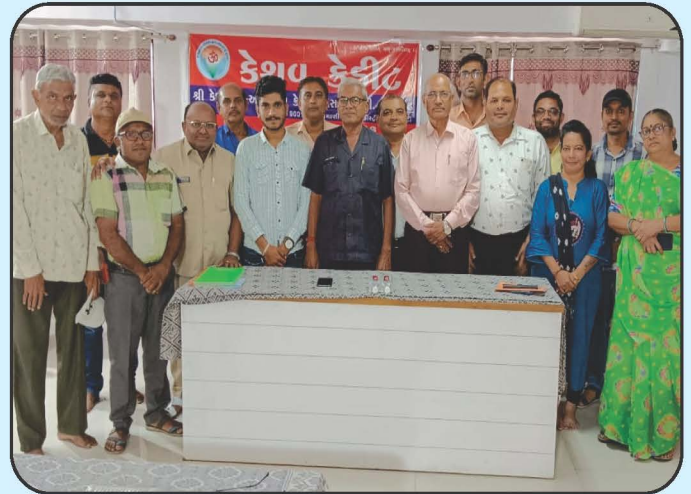
દૈનિક કલેક્શન એજન્ટ અભ્યાસ વર્ગ Daily Collation Agent Abhyash Varg