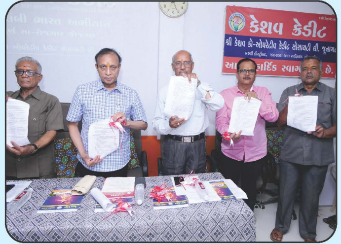
કેશવ મિત્ર તથા પૂર્ણ સ્વરોજગાર પોલીસી લોકાર્પણ Keshav Mitra & Purn Swarojgar Policy Lonching