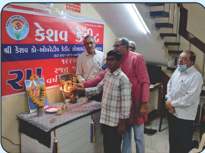
ડૉ. હેડગેવારજી જન્મદિન ઉજવણી Dr. Hedgevarji Janmotsav Celebration