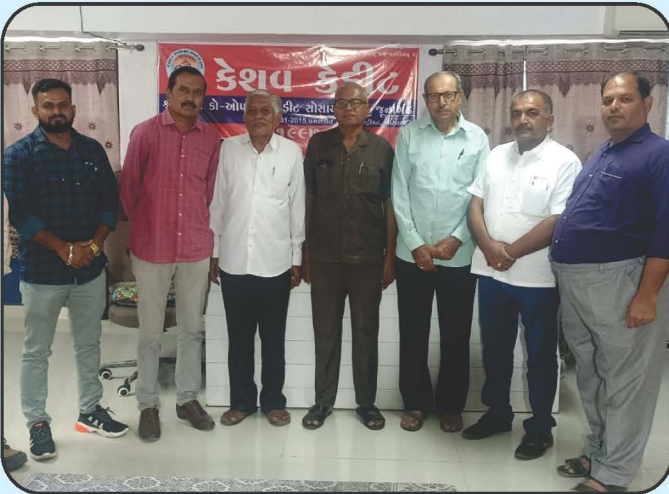
बोटाड क्रेडीट सोसायटीनी शुभेच्छा मुलाकात Visit by Botad Credit Society