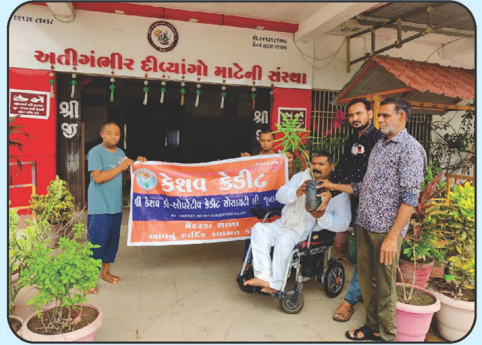
ગ્રામ્ય વિસ્તારોમાં વૃક્ષારોપણ કાર્યક્રમ Tree Plantation Programme in Rural Area