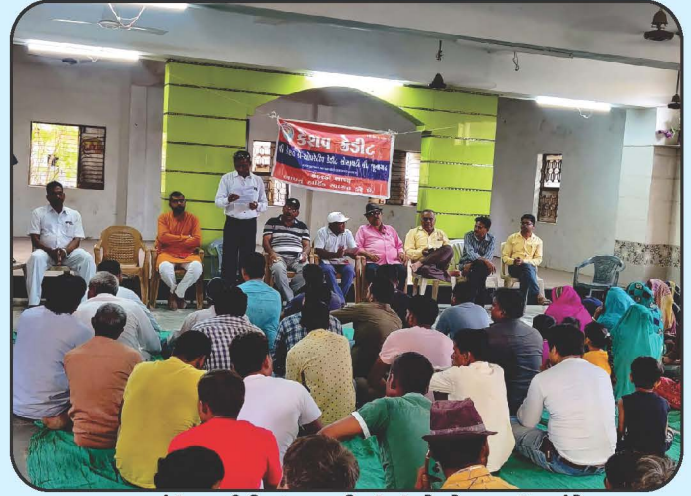
રજત જયંતિ વર્ષની ઉજવણી નિમિત્તે પેટાજ્ઞાતિ સંમેલન Rajat Jayanti Celebration with Petagyati Samelan