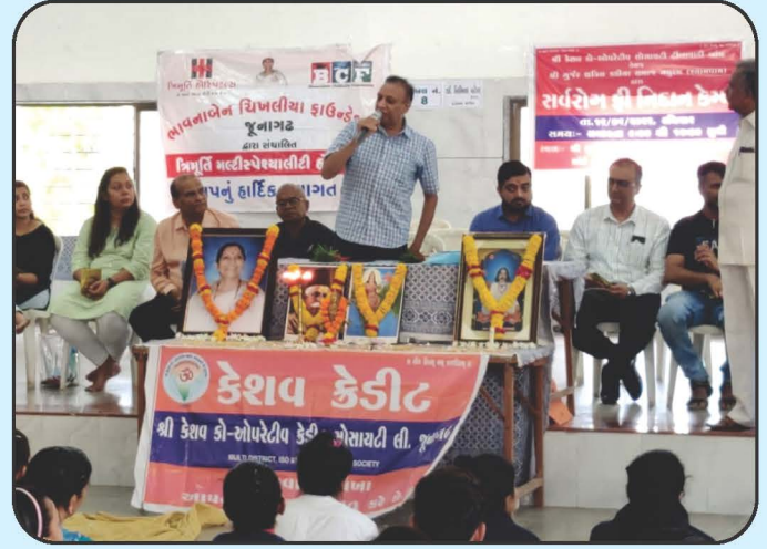
સર્વરોગ નિવાન કેમ્પ Medical Camp