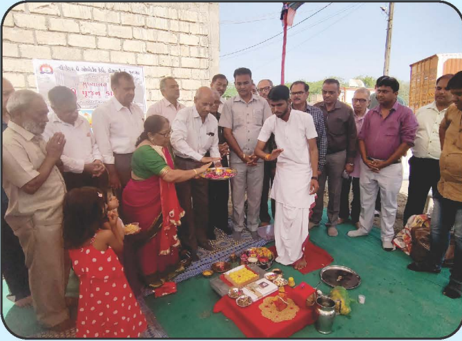
હેડઓફીસના નવા ભવનનો ભૂમિ પૂજન કાર્યક્રમ Head Office New Building Bhumi Pujan