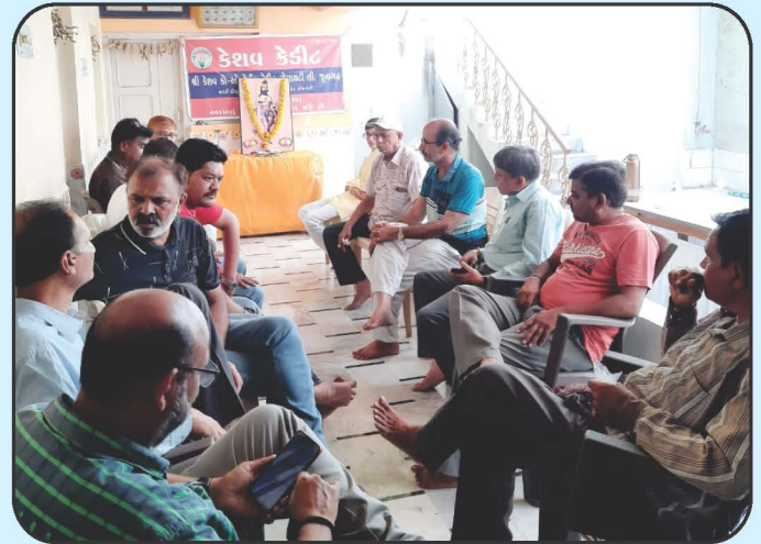
શ્રી પરશુરામ જન્મોત્સવની ઉજવણી કાર્યક્રમ Shree Parsuram Janmotsav Celebration