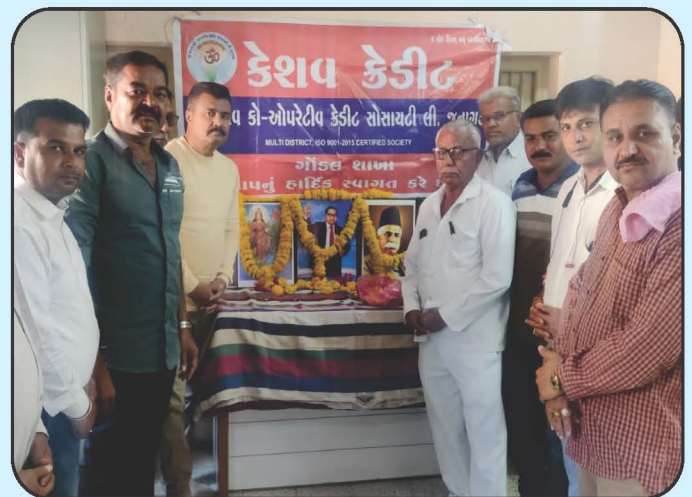
ડૉ. આંબેડકરજી જન્મદિન ઉજવણી Dr. Ambedkarji Janmotsav Celebration