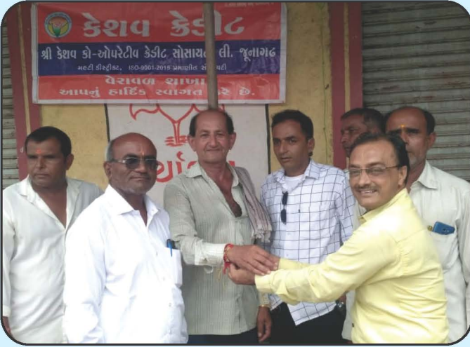
ગ્રામ્ય વિસ્તારોમાં રક્ષાબંધન કાર્યક્રમ Rakshabandhan Programme in Rural Area